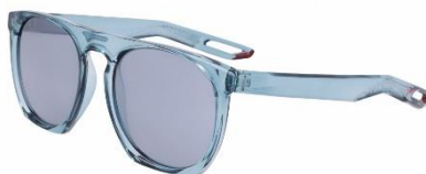
NIKE FLATSPOT XXII DV2258