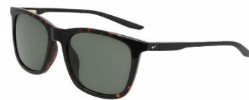
NIKE NEO SQ DV2375