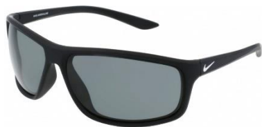
NIKE ADRENALINE P EV1114