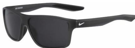
NIKE PREMIER EV1071