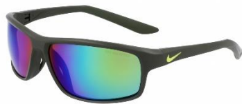
NIKE RABID 22 M