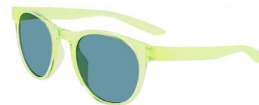
NIKE HORIZON ASCENT S DJ9936